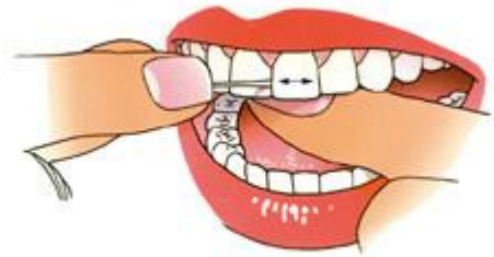
Breng de draad met gedoseerde kracht door het contactpunt

2. Breng met behulp van uw duimen en wijsvingers de draad met gedoseerde kracht en heen-en-weergaande bewegingen door het punt waar de tanden of kiezen elkaar raken (contactpunt). Doe dit voorzichtig en voorkom doorschieten.