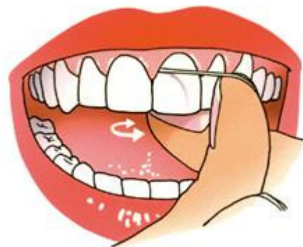
Breng de draad voorzichtig onder het tandvlees

4. Trek de draad nu strak om de aangrenzende zijkant van de tand of kies. Breng de draad weer voorzichtig onder het tandvlees. Stop als u weerstand voelt. Breng de draad, terwijl die contact houdt met de zijkant van de tand of kies, met korte heen-en-weergaande bewegingen terug tot het contactpunt.