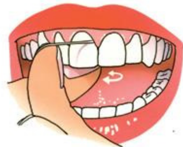
Trek de draad strak om de tand of kies

3. Trek de draad na het contactpunt strak om de tand of kies. Breng de draad onder het tandvlees totdat u weerstand voelt. Het mag geen pijn doen. Haal de draad dan, terwijl die contact houdt met de zijkant van de tand of kies, met korte heen-en-weergaande bewegingen terug tot het contactpunt.