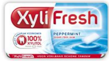
Kies suikervrije kauwgom

Verschillende medicijnen hebben als bijwerking dat de speekselklieren worden geremd in de afgifte van speeksel. Dit zijn vooral medicijnen die gebruikt worden bij de behandeling tegen hoge bloeddruk (antihypertensiva), hartritmestoornissen (digoxine, anti-aritmica) of medicijnen, zoals antidepressiva, slaap- en plasmiddelen. De medicijnen tasten de speekselklieren zelf meestal niet aan, maar remmen alleen de speekselafgifte. Speeksel heeft een smerende werking bij het spreken, kauwen en slikken. Met behulp van speeksel kunnen we makkelijker bewegen met onze wangen, tong en lippen. Met speeksel bevochtigen we ons voedsel zodanig dat we het pijnloos kunnen doorslikken. Ook bevochtigt speeksel het mondslijmvlies, waarmee uitdroging wordt voorkomen. Bovendien heeft het een reinigende werking op tanden, kiezen en het mondslijmvlies. Daarnaast remt speeksel de werking en de groei van bacteriën en schimmels in de mond, waardoor mondinfecties worden voorkomen. Als uw kind of cliënt onvoldoende speeksel heeft, vormt tandplak zich sneller dan normaal. Hierdoor ontstaan er sneller gaatjes. Dit gebeurt vooral wanneer uw kind of cliënt regelmatig suikerbevattend voedsel eet of drinkt. In een droge mond treden de vorming van tandplak en gaatjes vooral op langs de randen van het tandvlees. Hierdoor kan bovendien het tandvlees gaan ontsteken. Medicijngebruik kan ook andere gevolgen