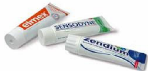
Gebruik een niet-schurende tandpasta