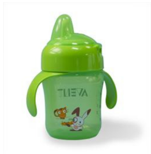
Laat uw kind vanaf 9 maanden uit een beker

Ook hier geldt: mondhygiëne. Zorg ervoor dat u