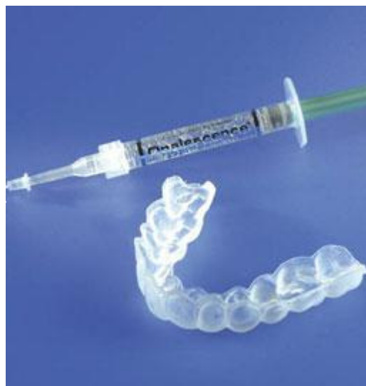
Van de tandarts of mondhygiënist krijgt u de doorzichtige bleeklepel en de gel met de blekende werking mee naar huis