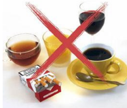
Tijdens de behandeling met de bleeklepel is het gebruik van deze producten af te raden