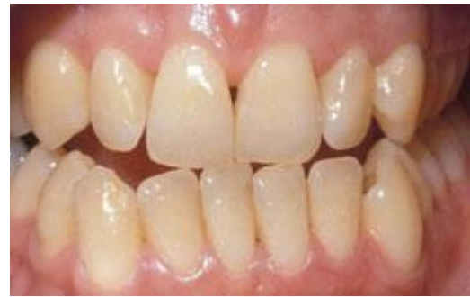
Voor het bleken