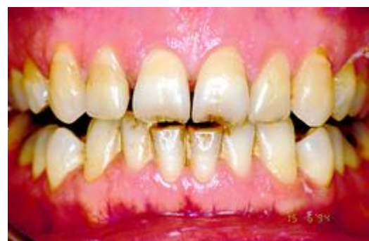
Verkleuring door verouderingsproces