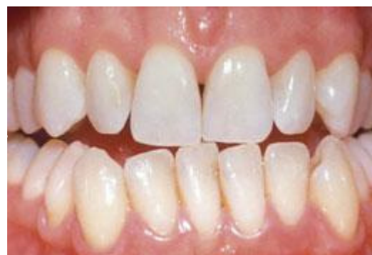
Resultaat na tien dagen bleken met de thuisbleekmethode onder begeleiding van de tandarts.

De lengte van een bleekbehandeling hangt af van de bleekmethode. Bij de thuisbleekmethode duurt het