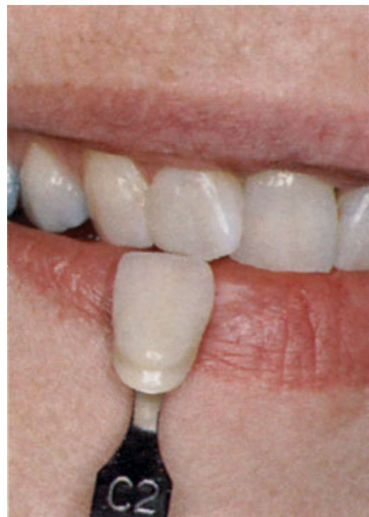
De gewenste kleur bepalen

Eerst kiest de tandarts in overleg met u de juiste kleur van uw facing. Het effect van de gewenste kleur kan de tandarts u direct laten zien. Hij heeft verschillende kleuren tot zijn beschikking die hij met elkaar kan combineren. U kunt het vergelijken met het mengen van verschillende soorten verf.