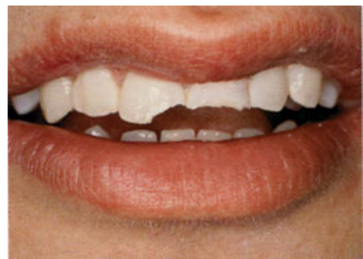
Door een val zijn twee tanden gebroken

Een facing is een laagje tandkleurig vulmateriaal van composiet of een schildje van porselein. De tandarts plakt het vulmateriaal op de tand. Zo kan hij de vorm of de kleur van een tand veranderen. Ook kan hij spleetjes tussen tanden opvullen, afgebroken hoekjes repareren, gele of bruine tanden weer wit maken en scheve tanden maskeren.