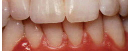
Op de tand is een porseleinen facing geplaatst

vervolgens in het tandtechnisch laboratorium in deze kleur gemaakt.