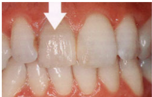
De tand is verkleurd