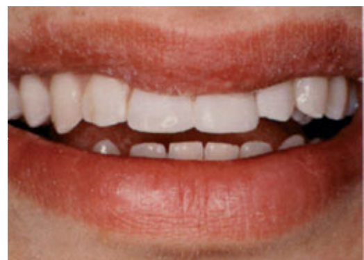
Nog dezelfde dag zijn de tanden met composiet hersteld