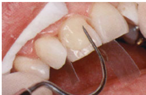
De tandarts brengt de composiet op het oppervlak globaal in vorm