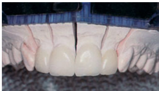
Porseleinen facings op een mal