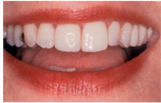
De facing van composiet heeft zowel de kleur als de stand van de tanden verbeterd