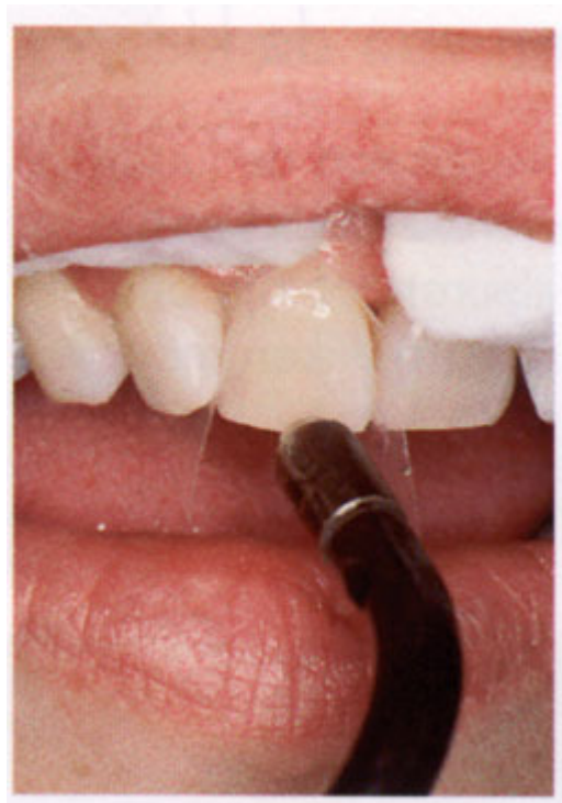
De hechtlaag is aangebracht

Nadat de ongeslepen tand is voorbehandeld met een zuur ziet het oppervlak er mat uit