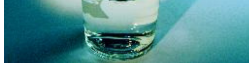
Neutraliseer zuur met water, melk of kaas

Neem in plaats van zure producten of na gebruik ervan een glas water of melk, of een klein stukje kaas. Zo voorkomt of beperkt u de schadelijke invloed van zuren.