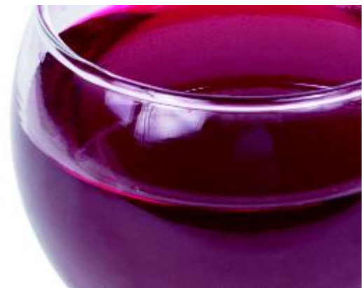
Zuur zit onder andere in wijn ...

Zuren in voeding en dranken kunnen tanderosie veroorzaken. Zuur zit onder andere in (sinaas)appels, citroenen, grapefruit, kiwi's, vruchtensappen, (light)frisdranken (ook ijsthee), wijn en bijvoorbeeld breezers. Tanderosie is een sluipend proces dat niet gemakkelijk te herstellen is. Het gaat niet alleen om hoevél zure producten u eet en drinkt. Het gaat vooral om hoe vaak, hoe lang, de tijdstippen en de manier waarop u dat doet. Wanneer tanderosie niet wordt bestreden, kunnen zuren het tandglazuur en vervolgens zelfs het blootliggende tandbeen oplossen. Zie verder wat veroorzaakt tanderosie?