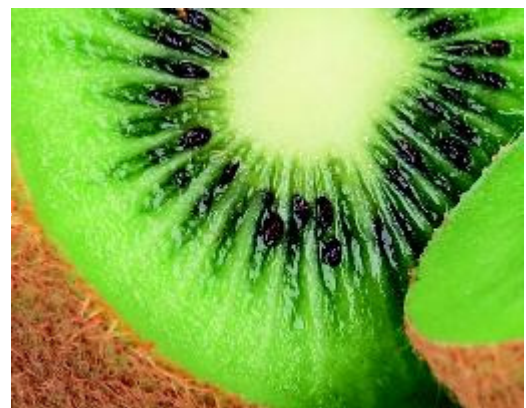
... in kiwi's en in citrusvruchten